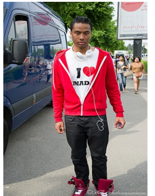
RNS 2011, RNS 2010