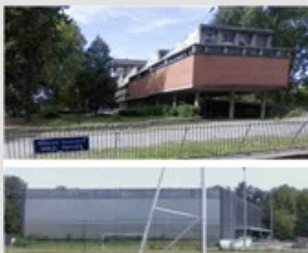
1975: première RNS à la Cité et au gymnase universitaires de Ranguel de Toulouse

Le Comité de programme sportif veille au bon déroulement des tournois par la mise en place de différents niveaux de compétence technique, répondant ainsi aux attentes de chaque participant. Les sportifs de haut niveau développent davantage leur compétence, alors que d'autres jouent pour se retrouver entre étudiants malgaches♦