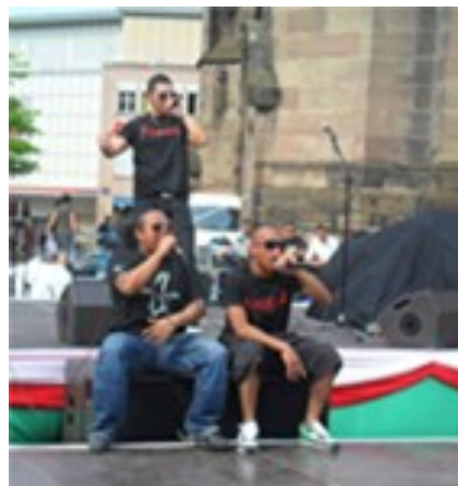
Les jeunes Malgaches : à la croisée des cultures JMSHA sur la Place de la Réunion à Mulhouse RNS 2011

qu'est-ce la culture, sinon des chemins battus, des sillages inexplorés qui marquent un attachement aux rites ancestraux et un envol pour des expériences nouvelles qui revendiquent des influences à la croisée des cultures. Des racines et des ailes pour l'édition 2012.