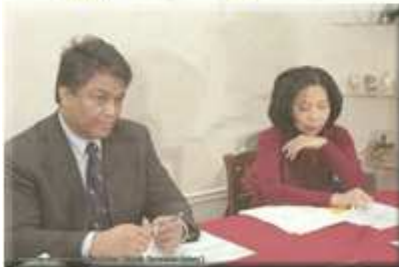
Présentation dossier site 2004