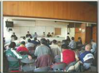
AG des assos Vichy 2004