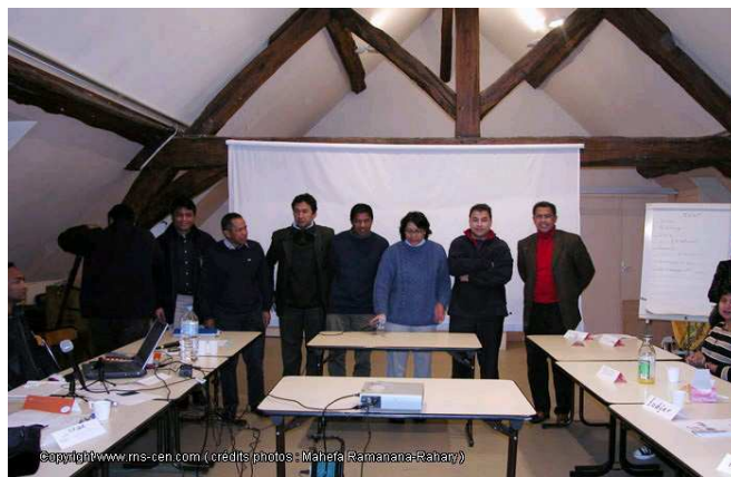
Les membres du CEN (Bureau 2003-2005)

Le nombre de participants à la RNS a multiplié par 10 par rapport à ses débuts : il était devenu urgent et incontournable de « professionnaliser » son organisation : la création du CEN a vu le jour.