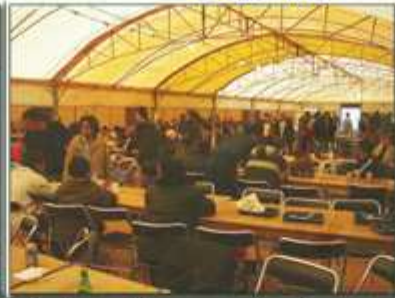
Restauration sous chapiteau 2004