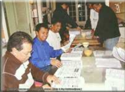
Travail à la chaîne pour la comm'