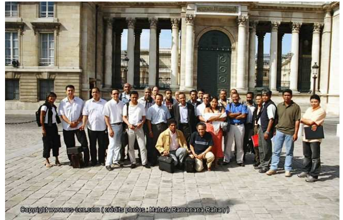
AG du 28 mai 2005 à Paris