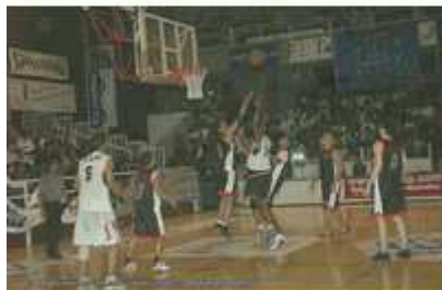
Finale Basket 2006