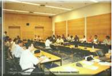
AG pour l'élection du CEN à l'Assemblée Nationale 2005