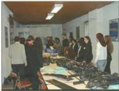
Briefing avec les hôteses