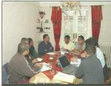
Préparation RNS 2005