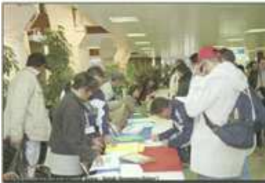
Accueil des participants