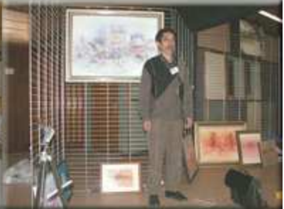
Exposition peinture 2006