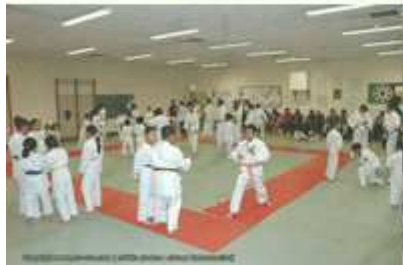
Les Arts martiaux avec ses 10 disciplines