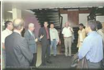
Contact chaleureux avec les décideurs de Vichy