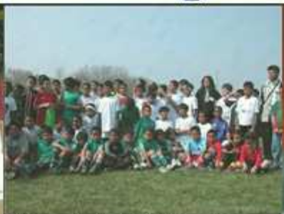
L'avenir de la RNS : les jeunes membres