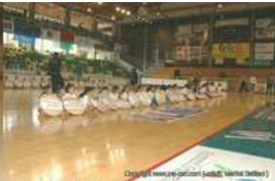
Présentation des assos