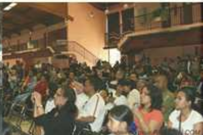
Public des spectacles 2007