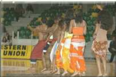
Extrait fête des assos