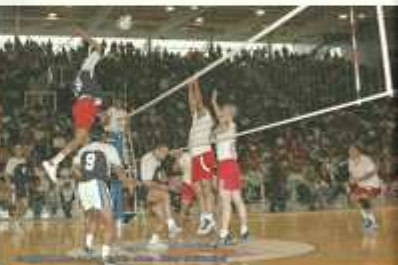
Finale Volley 2006