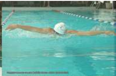
Natation : nouveauté 2006