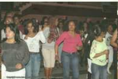
Ambiance de la soirée de clôture