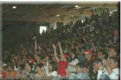
Ambiance finales 2006