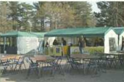
Restauration conviviale 2007