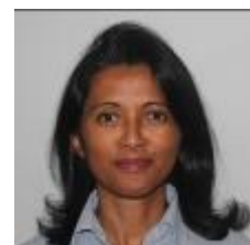
Propos recueillis par Hanitra Rabefitseheno

Le destin de Madagascar passe par celui de la Haute-Matsiatra, c'est indéniable, car pour que Madagascar réponde aux critères d'un pays développé, les 22 régions qui la composent doivent contribuer à leur développement.